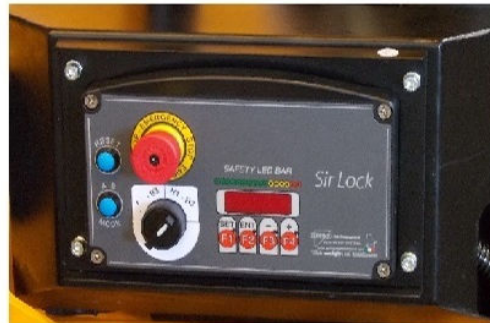
Sistema di sicurezza Sir Lock, con controllo delle travi con sensore lineare